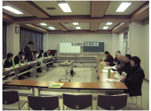
4月17日 町民センター