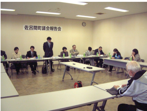
4月18日 浜佐呂間活性化センター