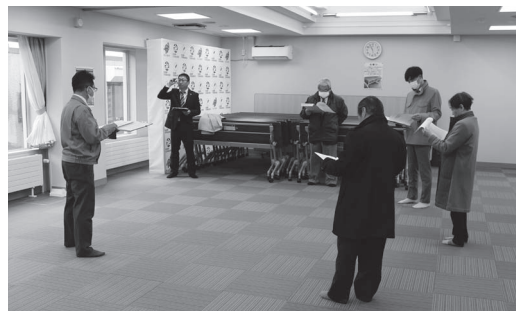
保健福祉課長からの説明（第1集会室にて）