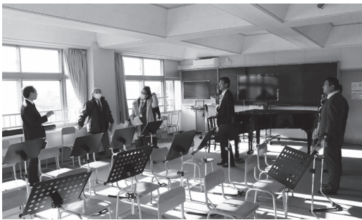
室温が高温となる校舎3階の音楽室

的な教材となり、発電量をリアルタイムで可視化するモニターシステムにより将来的な探求学習の先駆けとして環境教育の推進が図られます。