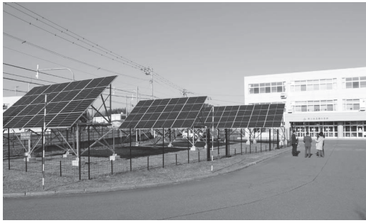
校舎前方に設置された太陽光発電パネル