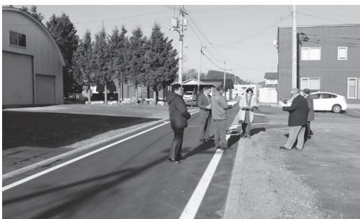
整備された佐呂間上町道路

今後においても、町民が安全・安心に生活ができるよう、計画的かつ適正な町道の維持管理に努めていただきたいと思います。