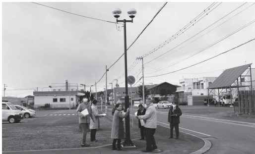
クリニックさろま駐車場横の街路灯

今後も、住民ニーズに応えた必要箇所の外灯整備や不要箇所の撤去など、適正な維持管理をお願いします。