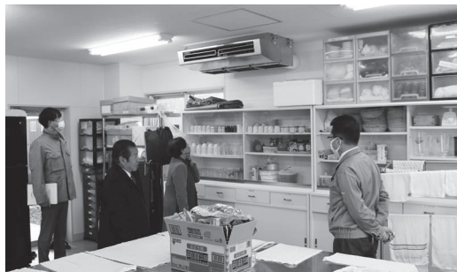
厨房に設置された大きな天吊型エアコン

近年、夏季における気温上昇傾向が著しく、各公共施設では順次、熱中症対策としてエアコン設置などの対応策を講じてきましたが、老人クラブなど高齢者の活動拠点となっている当施設は未整備であったことから、第1集会室に2基、第2集会室に1基、各団体に幅広く利用されている厨房に天吊型1基のエアコン整備を決め、令和5年7月中旬に設置を完了しました。