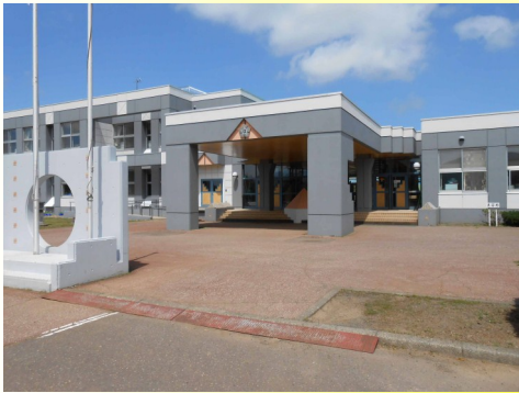
ことばの教室が開設された佐呂間小学校

童は1〜5校時の間でことばの教室に移動して、若佐小学校と浜佐呂間小学校の児童は各学校の授業終了後、保護者の送迎で佐呂間小学校に通う形で行われています。