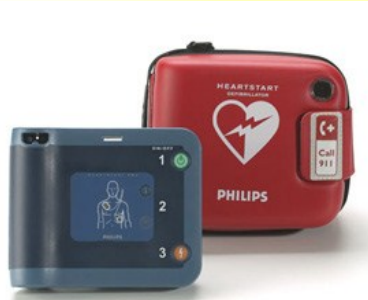
自治会連合会で貸出予定のAED

【答弁】今はまだ受けていないが、今回の購入に当たり広く周知を図るとともに、3地区のコミセンで自治会主催の講習会を開催する計画をしています。