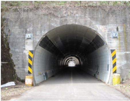
点検予定の町道旭峠道路の旭トンネル

しかし道民の安全・安心な航空交通を確保するには、この航空交通管制部を存続させることが重要であることから、存続・充実を要望する意見書が可決され、関係大臣宛提出されました。