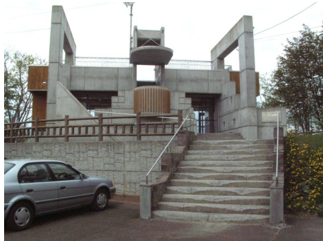
階段等の改修が行われるピラオロ展望台