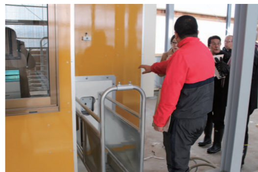
哺育舎の哺育ロボット

佐呂間町農協哺育育成施設については、国の畜産競争力強化対策緊急整備事業として591.9万8千円の補助を受け、総事業費1億589.8万3千円をもって、哺育ロボット舎1棟、初期育成舎1棟、中後期育成舎1棟、堆肥舎1棟などを増設したものです。 今回の増設により飼養規模は400頭から600頭へ増頭となり、新規預託希望などへの対応が可能となり、厳しい畜産経営の環境改善の一助となるものと期待するところとです。