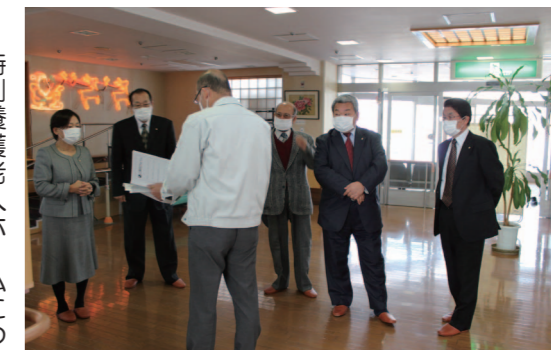
特別養護老人ホームにて説明を受ける

行政報告の後、一般質問では3名の議員さんが質問に立ち、新年度予算、少子化対策等の質問がありました。それぞれ細かく調査され質問し、理事者も丁寧に答えられ、傍聴する側にとっては非常にわかりやすい内容でした。しか