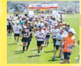
ハマナスが咲く6月下旬、サロマ湖100kmウルトラマランが開催。サロマ湖沿岸を走る爽快なコースが人気。