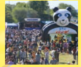
毎年10月第1日曜開催のサロマ大収穫祭。海の幸・山の幸が格安。特に貝付きホタテは大人気!