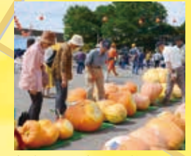
毎年9月上旬に開催されるシンデレラ夢。仮装パレード、パンプキンコンテストなど楽しい催しが盛り沢山。