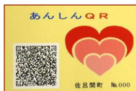
冷蔵庫用【ステッカー】