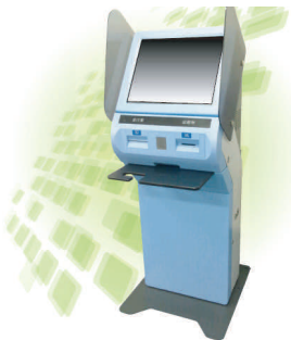
カルテなどの電子化により、導入が予定される自動再来受付機