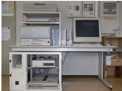
下水道管理センターから浜佐呂間などの汚水処理状況を監視する遠方監視装置