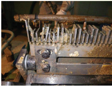
破損した除じん機の刃

◎下水道施設の維持管理に要する経費について 【質】下水道処理施設の除じん機故障の要因は。 【答】除じん機は、処理施設に流入してくる固形物などをスクリーナ状の刃で砕くためのもので、スプーン程度のものでは砕けるようになっていて、相当固いものが流入したため刃がかけたものと思われま