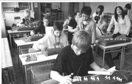
「ウーン、日本の華、ムズカシデスネ!」パーマ市交換留学生、等々 6/23撮影