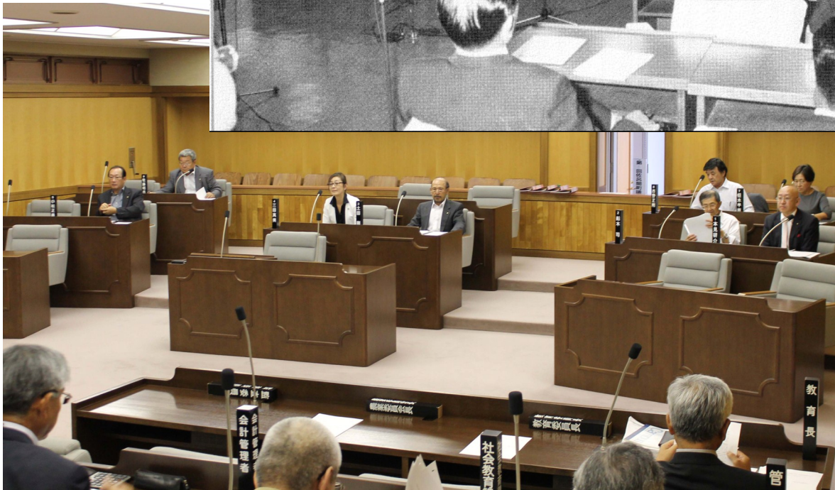
写真(上) 平成2年議会だより創刊当時の議会