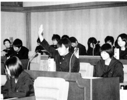
佐呂間高校生模擬議会(11月17日開催)の内容をお伝えします。