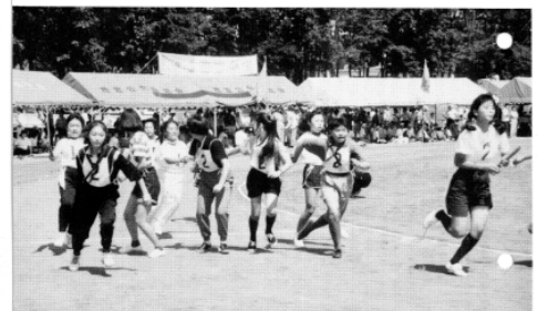
第12回 町民大運動会