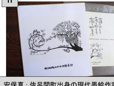
H サポーターズ倶楽部安保真デザイン色紙