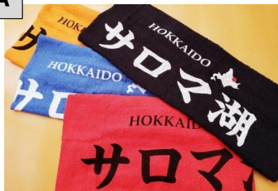
A 道の駅サロマ湖セット

佐呂間町内の宿泊施設に1泊以上宿泊された方へご希望のお品を1点プレゼントします。