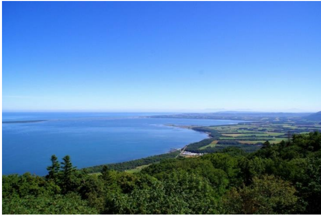
サロマ湖展望台からの風景